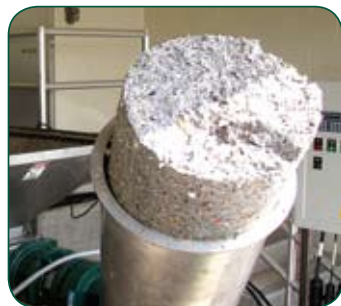
...к этому! Monster делает отходы с фильтров такими чистыми/ Вот как Monster очищает отходы с фильтров!